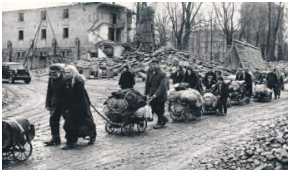
Mit dem Bollerwagen ins Ungewisse: Millionen flohen 1945 aus den Ostgebieten Deutschlands.

Trotz all dieser Entbehrungen gelang es den Schlesiern, neue Orte zu schaffen, an denen ihre Kultur weiterlebte. Städte wie Hannover, Stuttgart, München oder Düsseldorf wurden zu Zentren der Landsmannschaften. Schlesische Bräuche, Rezepte und Dialekte überdauerten Generationen – stille Erinnerungen an eine Welt, die ausgelöscht, aber nie vergessen wurde.